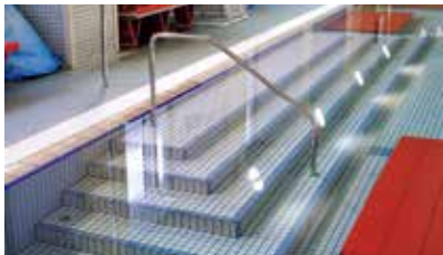
高齢者対応・出入りしやすい階段式スロープ