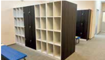
男女ロッカーリニューアルしました!