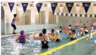
アクアピクス(無料ショートレッスン)