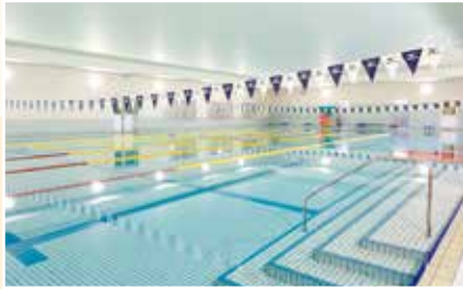
▲屋内25Mプール(6レーン+歩行専用1レーン)