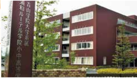
▲外観(無料駐車場 第①25台、第②50台完備)

お申込み方法 電話ご予約後、一週間以内に印鑑をご持参の上、フロントにて手続きください。 欠席の振替レッスンについて 参加費無料の特別企画のため、欠席による振替レッスンは出来ません。 キャンセルについて お申し込み後、ご都合によりキャンセルされる場合は、受講一週間前までにご連絡ください。